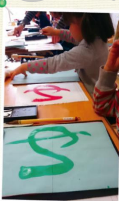
小学校の入学準備に