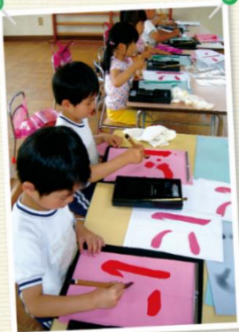
字に興味を持ち始めたら