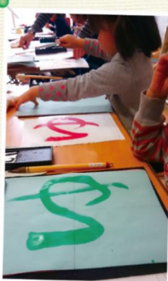
小学校の入学準備に