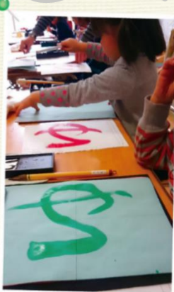
小学校の入学準備に